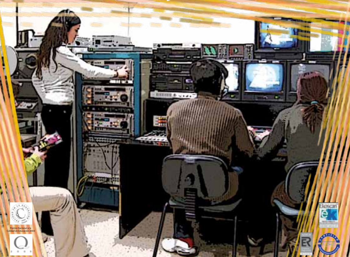
IMAGEN y SONIDO